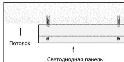
Рис.2 Настенный потолочный монтаж (накладной)